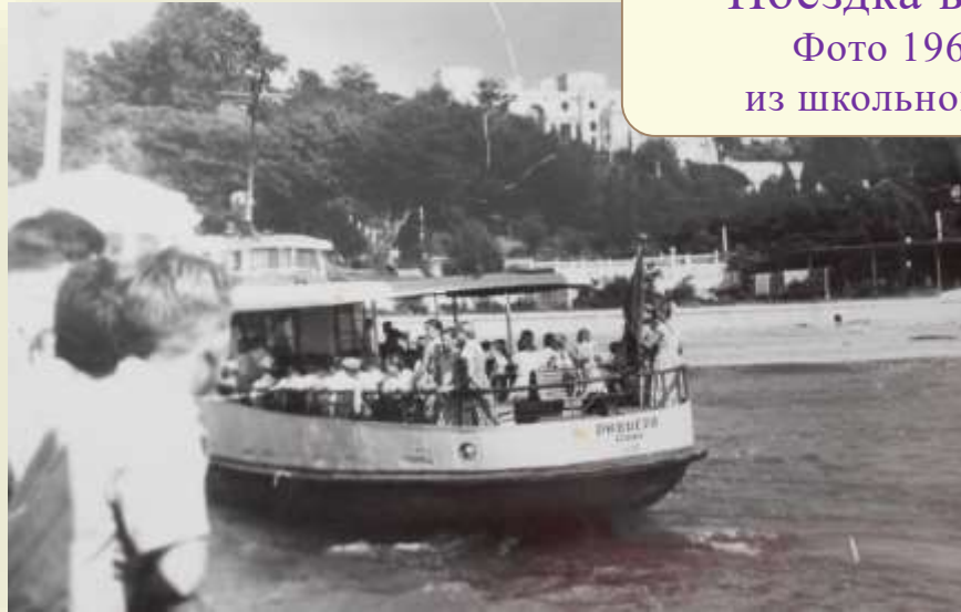
Поездка в г.Сочи. Фото 1966 года из школьного музея.