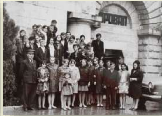
Экскурсия по КМВ Фото 1970 года из школьного музея